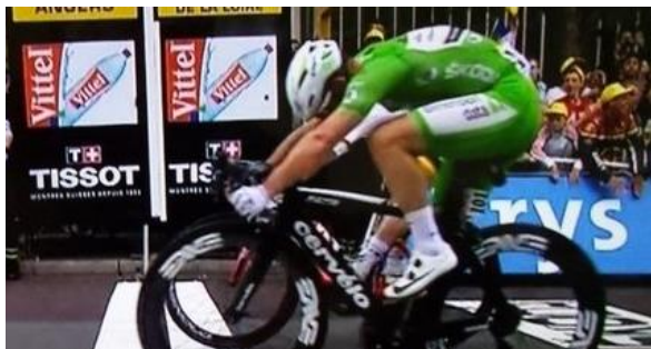
Parigi 2013, Mark Cavendish vince su André Greipel la volata dell'ultima tappa del Tour sviluppando 980 w per una velocità raggiunta di 62 kmh