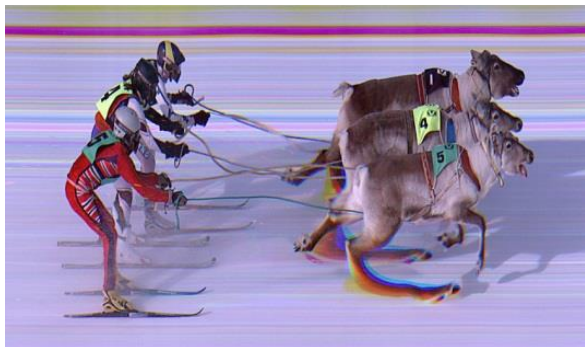
Scandinavia, Natale 2015. Le tre renne di Babbo Natale - Dasher, Dancer, Prancer - si giocano il tutto per tutto nella annuale competizione a loro riservata.